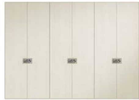
● MODELO 12 - CHAPA NATURAL ROBLE PORO ABIERTO LACADO LINO / FONDO TIRADOR EFECTO ESPEJO