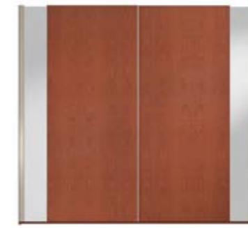
● MODELO 14 - CHAPA NATURAL CEREZO COLOR MON / VARETA ARENA BRILLO