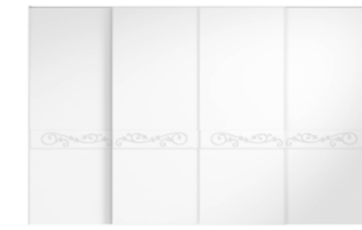
● MODELO 15 - CHAPA NATURAL ROBLE PORO ABIERTO LACADO BLANCO MATE