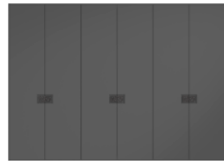
● MODELO 12 - LACADO ANTRACITA / FONDO TIRADOR EFECTO ESPEJO