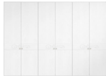
● MODELO 13 - CHAPA NATURAL ROBLE PORO ABIERTO LACADO BLANCO MATE / TIRADOR CHAMPANGE