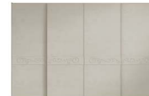
● MODELO 15 - CHAPA NATURAL ROBLE PORO ABIERTO LACADO ARENA