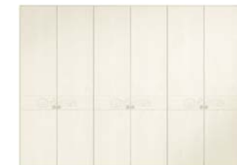
● MODELO 13 - CHAPA NATURAL ROBLE PORO ABIERTO LACADO LINO / TIRADOR CHAMPANGE