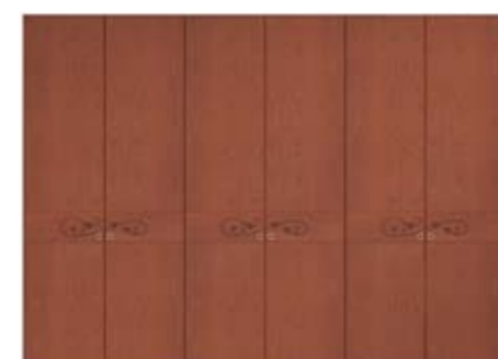
● MODELO 13 - CHAPA NATURAL CEREZO COLOR MON / TIRADOR CHAMPANGE