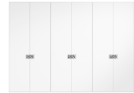
● MODELO 12 - LACADO BLANCO / FONDO TIRADOR EFECTO ESPEJO