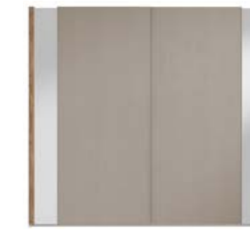
● MODELO 14 - LACADO TÓRTOLA / VARETA NOGAL ENVEJECIDO