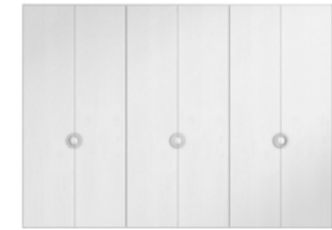
● MODELO 11 - CHAPA NATURAL ROBLE PORO ABIERTO LACADO BLANCO MATE / TIRADOR CROMO