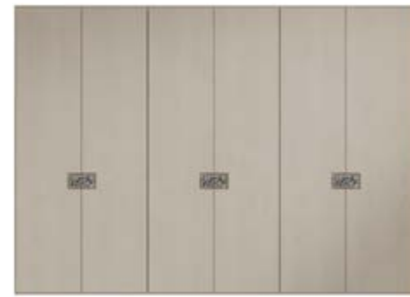
● MODELO 12 - CHAPA NATURAL ROBLE PORO ABIERTO LACADO ARENA / FONDO TIRADOR EFECTO ESPEJO