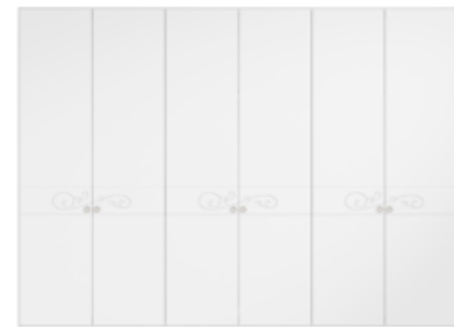
● MODELO 13 - LACADO BLANCO / TIRADOR CHAMPANGE