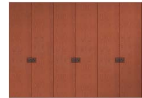
● MODELO 12 - CHAPA NATURAL CEREZO COLOR MON / FONDO TIRADOR NEGRO