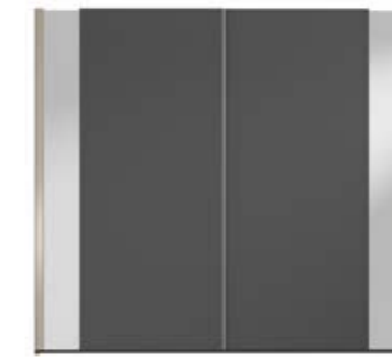
● MODELO 14 - LACADO ANTRACITA / VARETA ARENA BRILLO