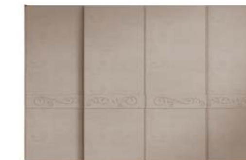
● MODELO 15 - LACADO TÓRTOLA