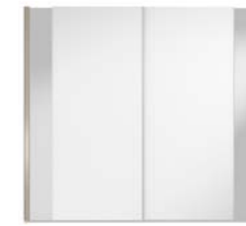
● MODELO 14 - LACADO BLANCO / VARETA ROBLE ENVEJECIDO