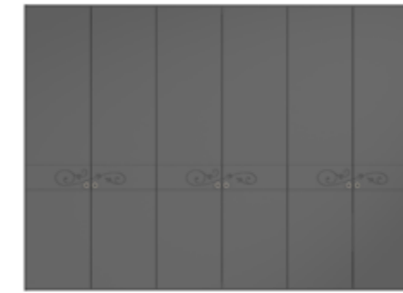
● MODELO 13 - LACADO ANTRACITA / TIRADOR CHAMPANGE