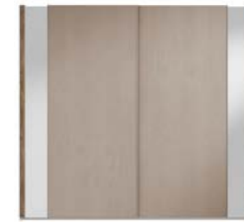
● MODELO 14 - CHAPA NATURAL ROBLE COLOR ROBLE ENVEJECIDO / VARETA ARENA BRILLO