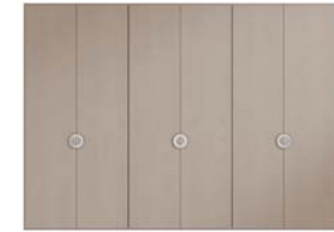
● MODELO 11 - LACADO TÓRTOLA / TIRADOR CROMO