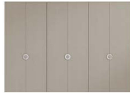
● MODELO 11 - CHAPA NATURAL ROBLE PORO ABIERTO LACADO ARENA / TIRADOR CROMO