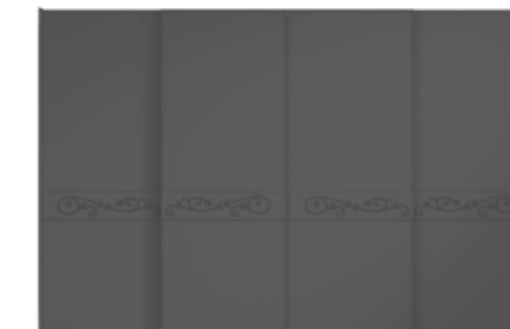
● MODELO 15 - LACADO ANTRACITA