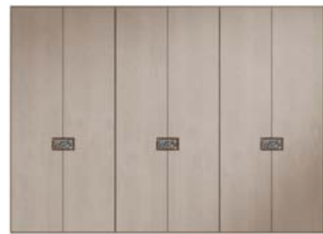
● MODELO 12 - LACADO TÓRTOLA / FONDO TIRADOR EFECTO ESPEJO