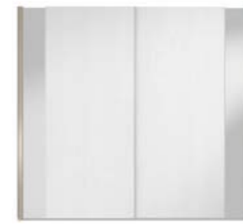
● MODELO 14 - CHAPA NATURAL ROBLE PORO ABIERTO LACADO BLANCO MATE / VARETA ARENA BRILLO