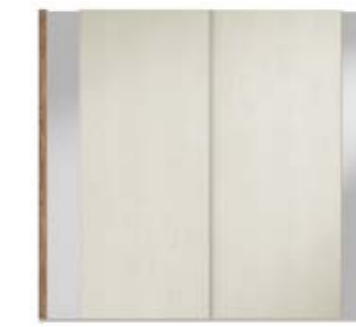
● MODELO 14 - CHAPA NATURAL ROBLE PORO ABIERTO LACADO LINO / VARETA ARENA BRILLO