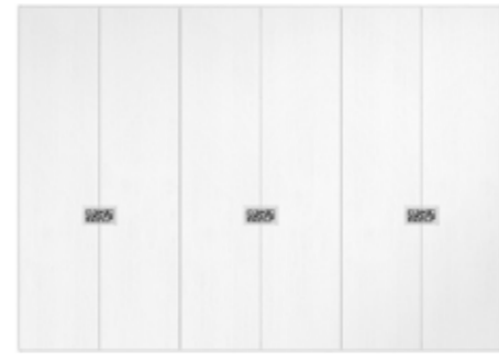
● MODELO 12 - CHAPA NATURAL ROBLE PORO ABIERTO LACADO BLANCO MATE / FONDO TIRADOR EFECTO ESPEJO