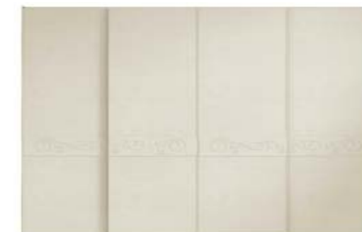
● MODELO 15 - CHAPA NATURAL ROBLE PORO ABIERTO LACADO LINO