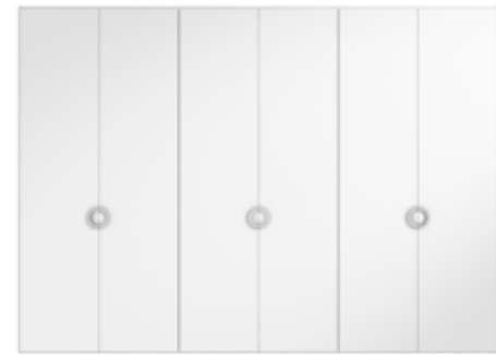
● MODELO 11 - LACADO BLANCO / TIRADOR CROMO