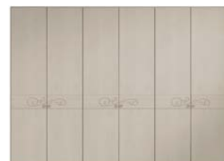
● MODELO 13 - CHAPA NATURAL ROBLE PORO ABIERTO LACADO ARENA / TIRADOR CHAMPANGE