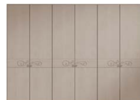
● MODELO 13 - LACADO TÓRTOLA / TIRADOR CHAMPANGE