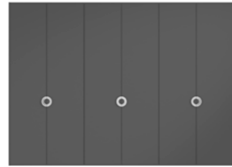
● MODELO 11 - LACADO ANTRACITA / TIRADOR CROMO