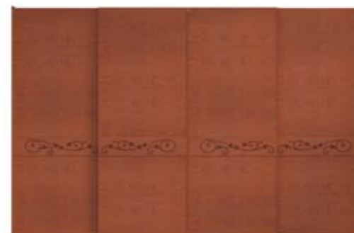
● MODELO 15 - CHAPA NATURAL CEREZO COLOR MON