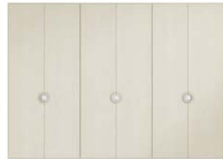
● MODELO 11 - CHAPA NATURAL ROBLE PORO ABIERTO LACADO LINO / TIRADOR CROMO