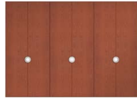
● MODELO 11 - CHAPA NATURAL CEREZO COLOR MON / TIRADOR CROMO